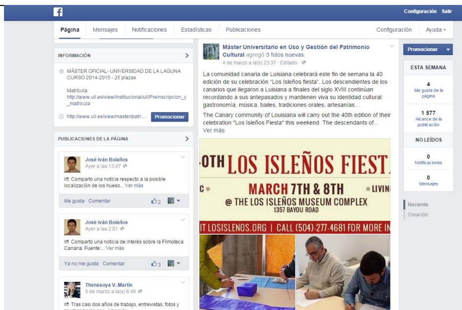
Figura 4. Vista de la página de Facebook el Máster en Uso y Gestión del Patrimonio Cultural.