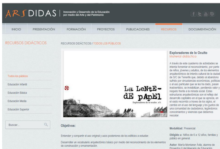
Figura 3. Vista de uno de los recursos didácticos publicados en la web de ARSDIDAS.